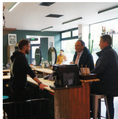
« Gario », coiffeur barbier situé avenue Saint-Maur.