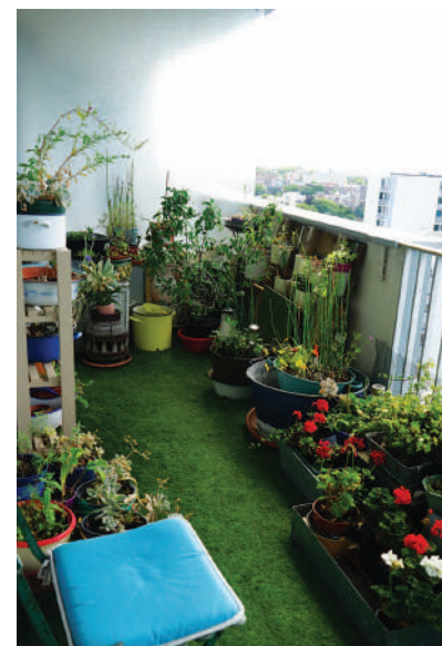
Participant à l'édition 2022, catégorie C « balcons et terrasses »

Inscrivez-vous gratuitement jusqu'au 9 juin en remplissant le formulaire disponible sur le site internet de la Ville (rubrique actualité). Déposez-le à l'accueil de la mairie ou envoyez-le par mail à service-technique@ville-lamadeleine.fr