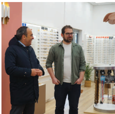
« Morgan Vision », opticien situé rue du Parc.