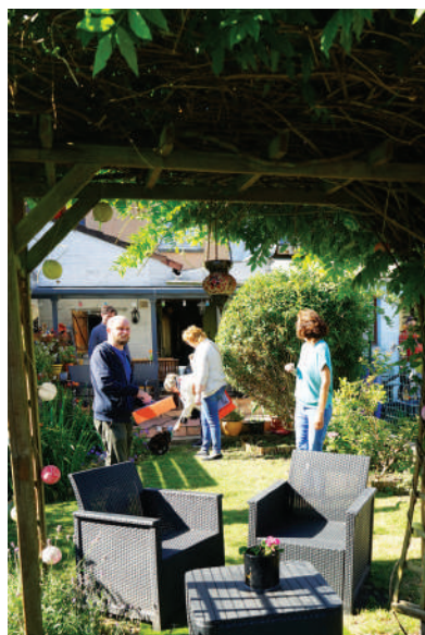
Participant à l'édition 2022, catégorie D « jardins secrets, non visibles de la rue »

De nombreux lots sont à gagner et seront remis à l'occasion d'un événement convivial... À vos arrosoirs, vos pelles et vos sécateurs !