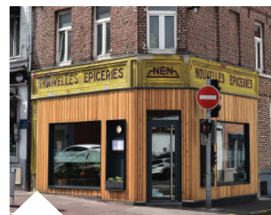
La façade du 233 rue du Général de Gaulle en mai 2023.