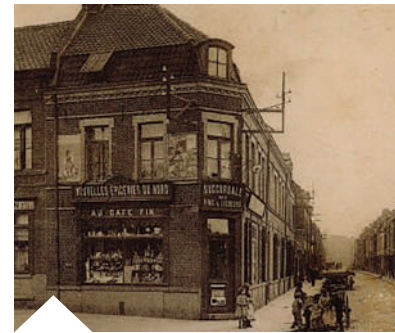
La façade du 233 rue du Général de Gaulle, entre la fin des années 20 et le milieu des années 30.

Le restaurant « La Maniguette » a décidé de changer son projet initial afin de préserver cette enseigne qui fait partie du patrimoine historique de La Madeleine.